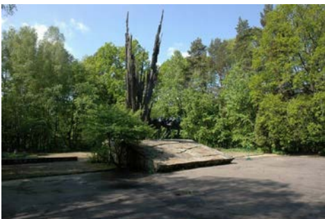
Pomnik Bohaterów Porytowego Wzgórza