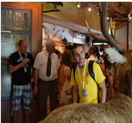
Wystawa przyrodnicza w OEE

Bory sosnowe, torfowiska, pomnik poświęcony partyzantom walczącym na Porytowym Wzgórzu, ostoja konika biłgorajskiego to tylko kilka atrakcji tej wycieczki.