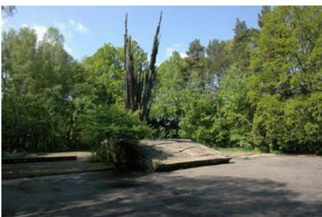
Pomnik Bohaterów Porytowego Wzgórza