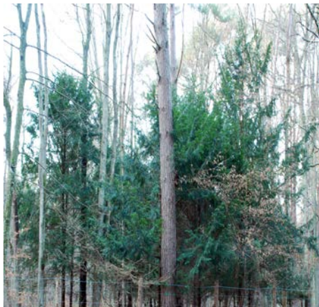
Rezerwat Choczewskie Cisy

Piaszczyste ruchome wydmy, zapach igliwia sosny, jeziora okolone lasami mieszanymi i liściastymi, przestrzeń, piękne krajobrazy i nadmorska wolność to tylko kilka atrakcji tej wycieczki.