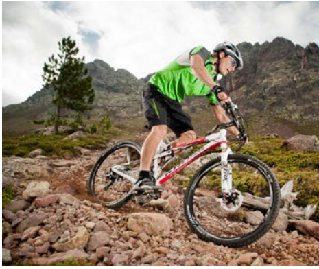
Rowerem w terenie