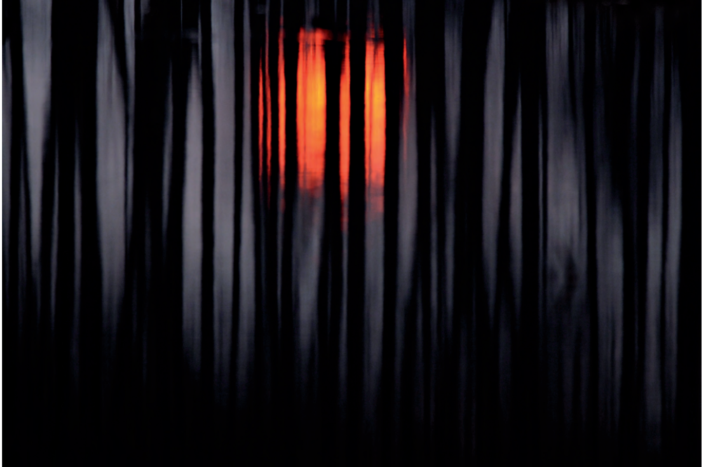
Piotr Socha: „Leśna impresja“