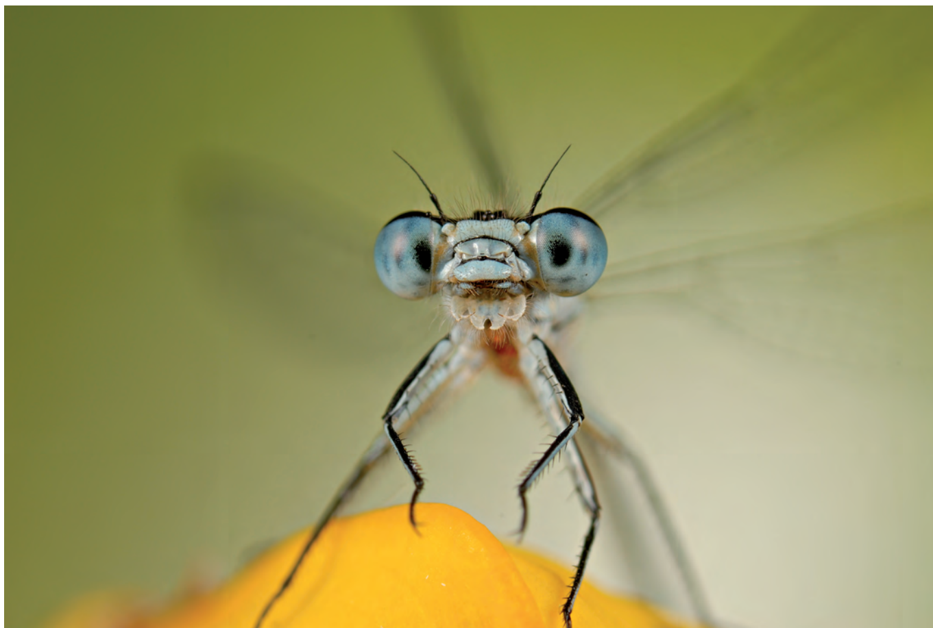
Wojciech Ostapowicz: „W cztery oczy”