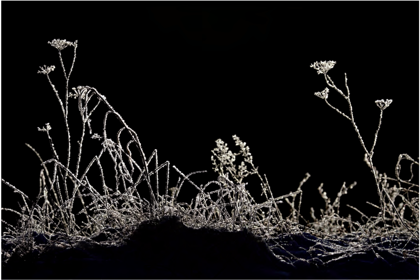
Ryszard Czaplewski: „W zimowym nastroju“