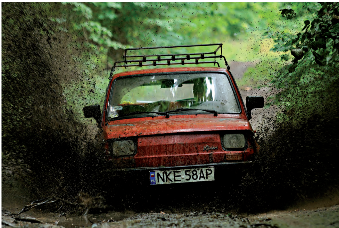
Karol Zalewski: „Off-road podleśniczego”