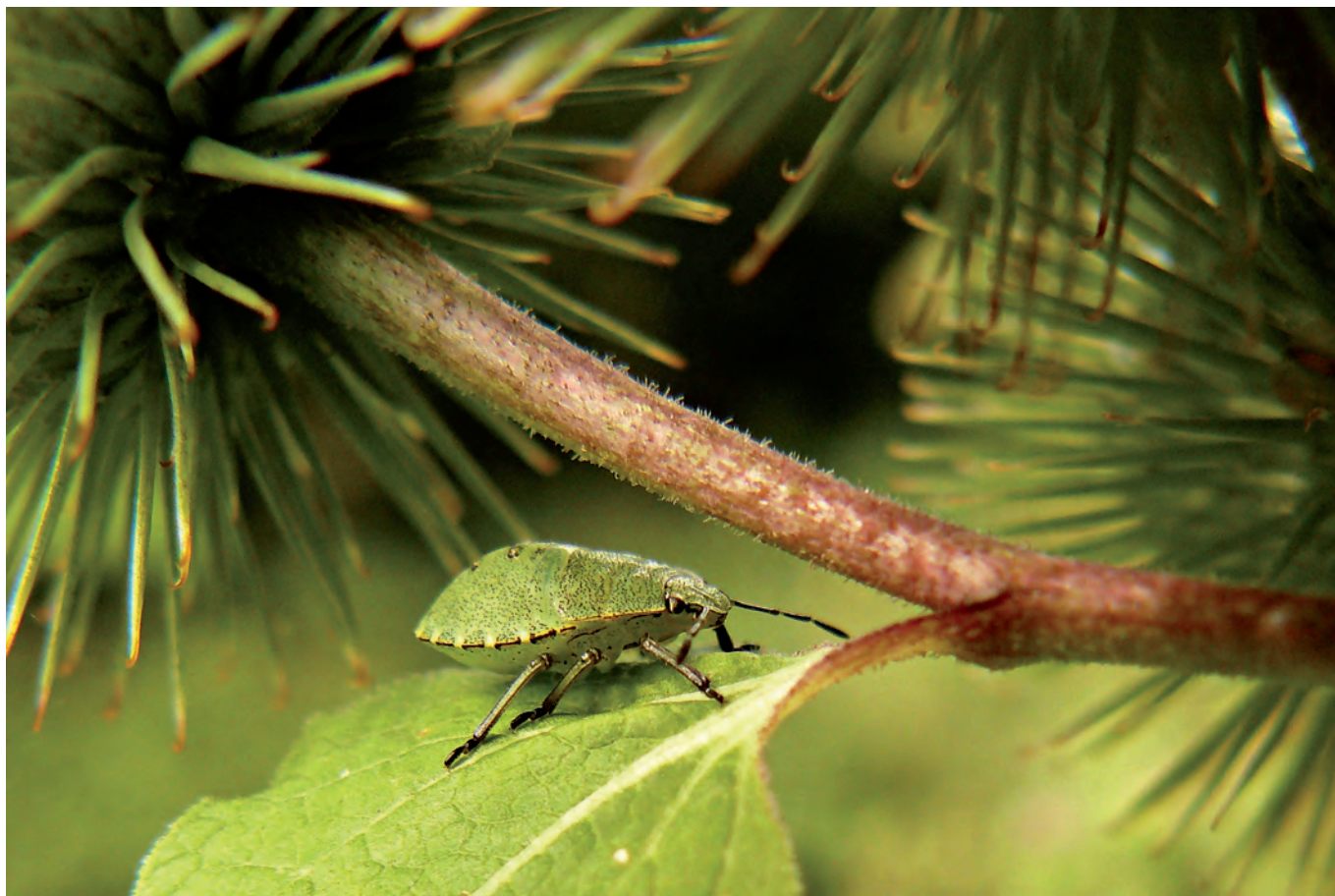
Stanisław Frasek: „Kamuflaż”