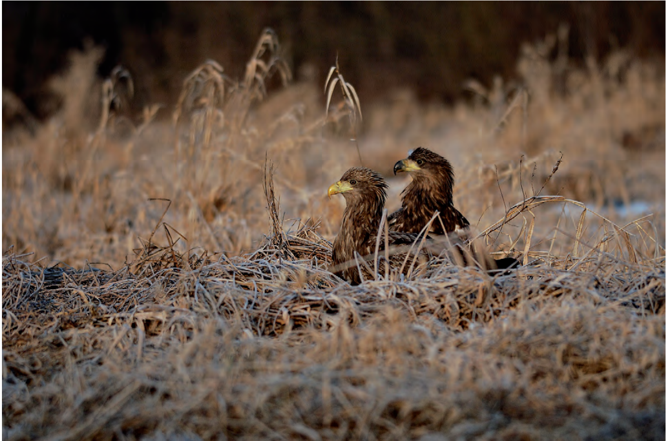
Paweł Kaczorowski: „Co dwie głowy...”