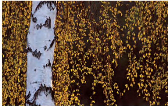
Ryszard Czaplewski: „Brzoza” Wyróżnienie w kategorii „Flora”