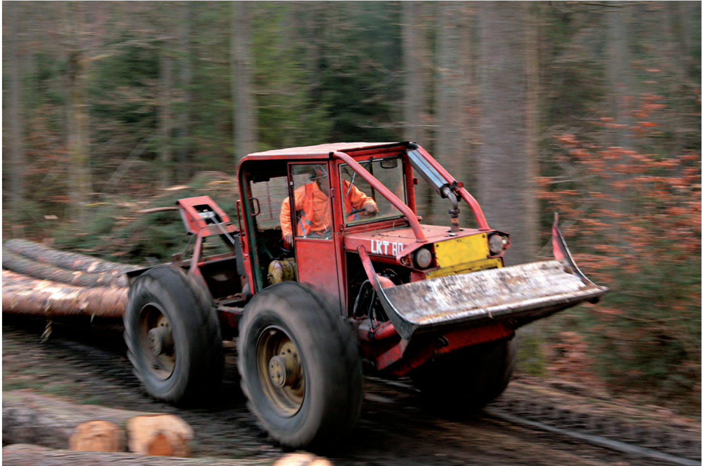
Dariusz Lenio: „Zrywka”