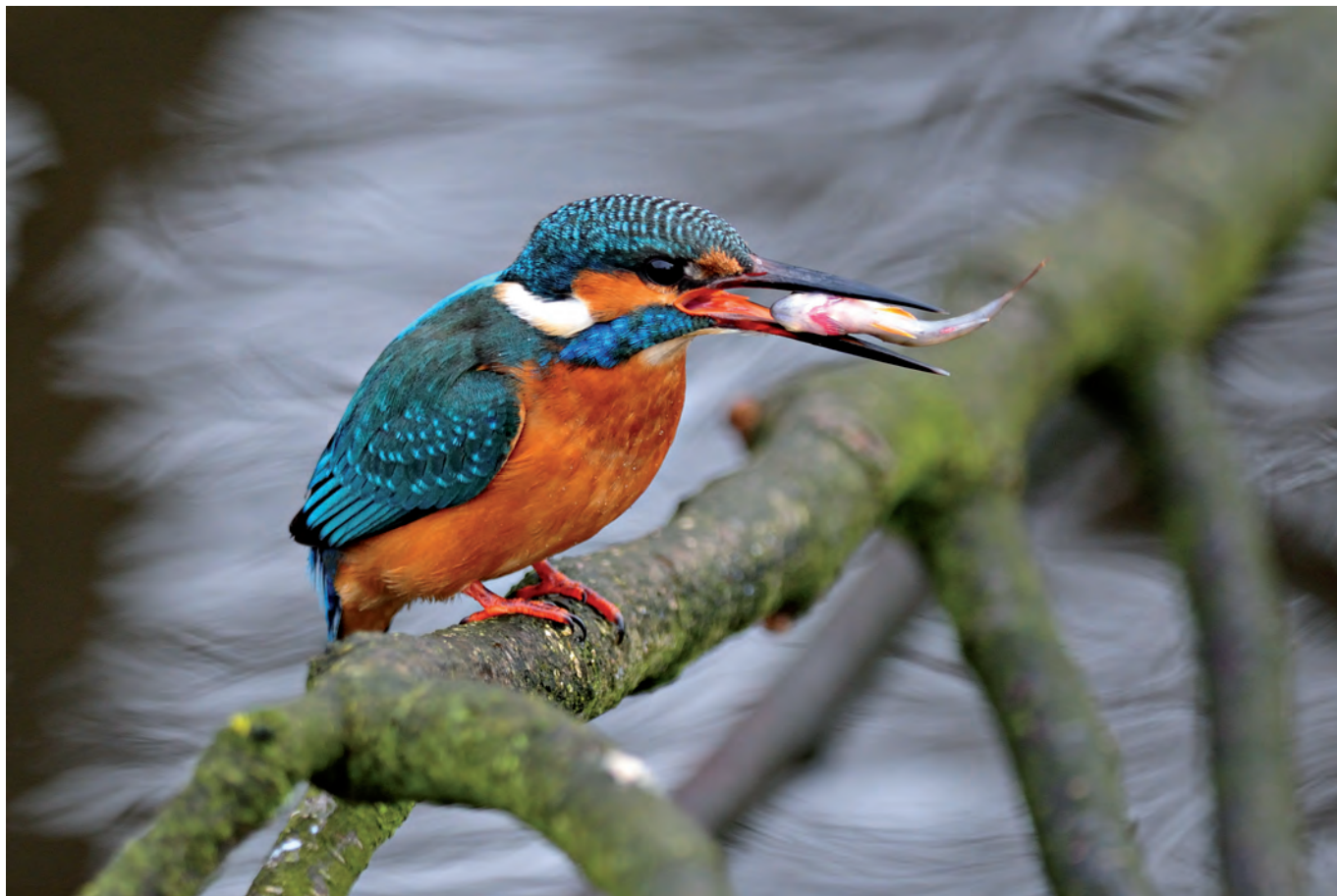
Piotr Socha: „Nad śródleśną rzeczką“