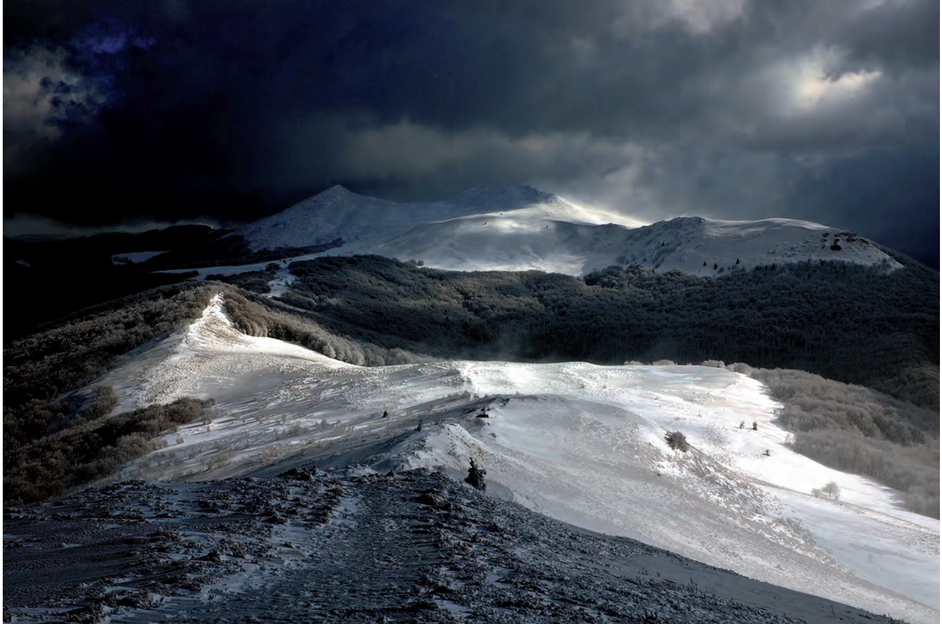
Roman Pasionek: „Bieszczadzka granica lasu“