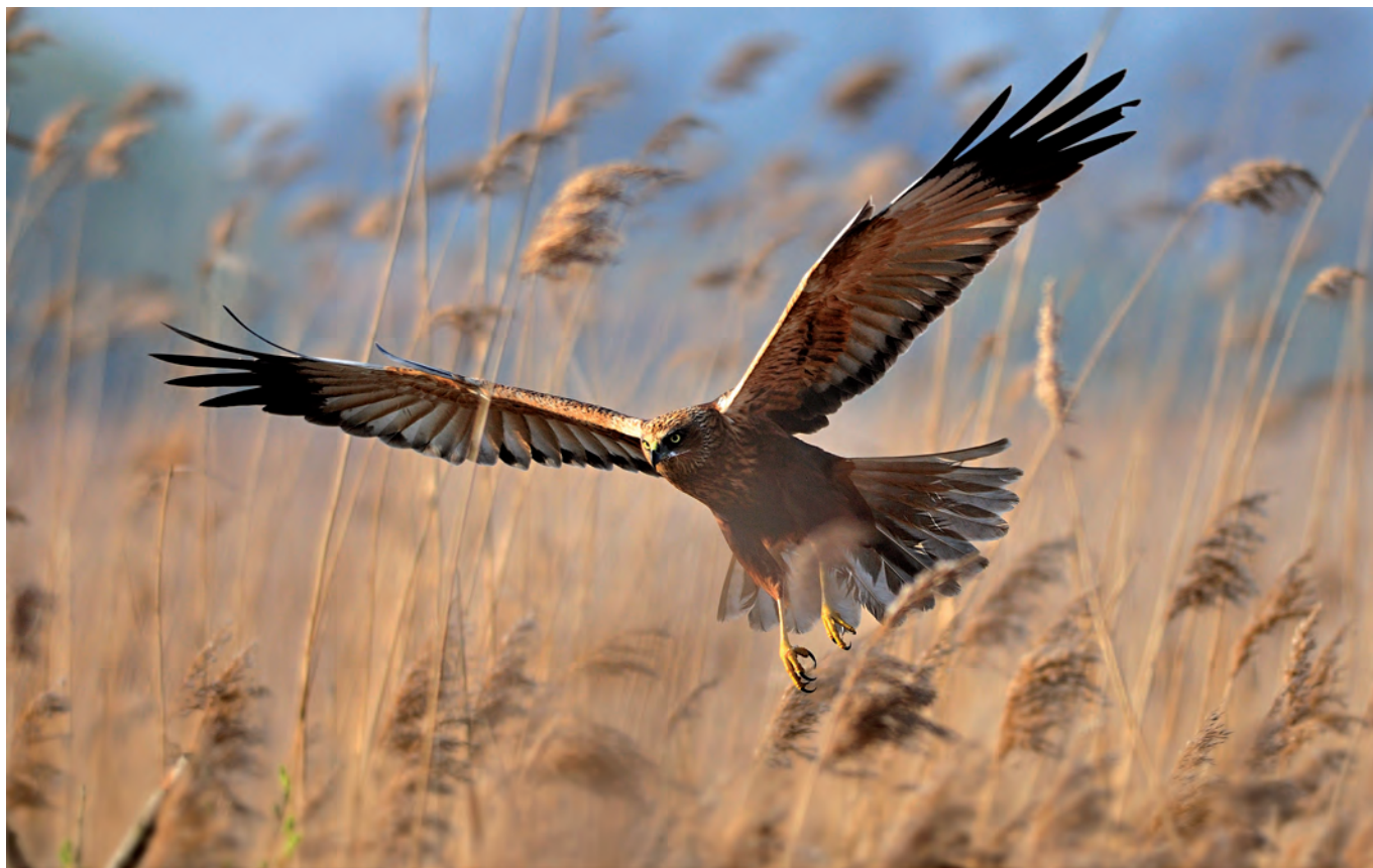
Paweł Kaczorowski: „Władca”