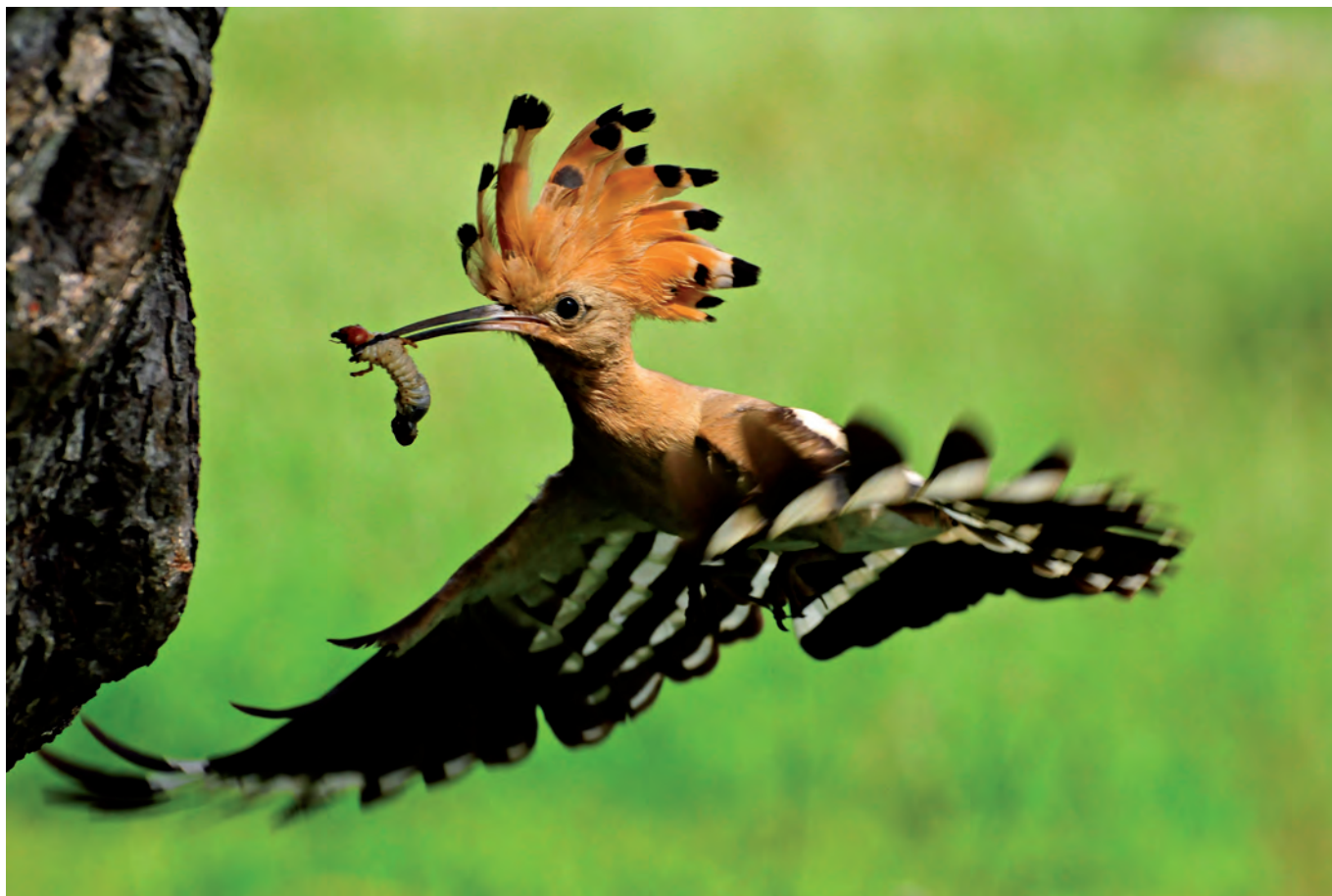
Piotr Socha: „Latający irokez”