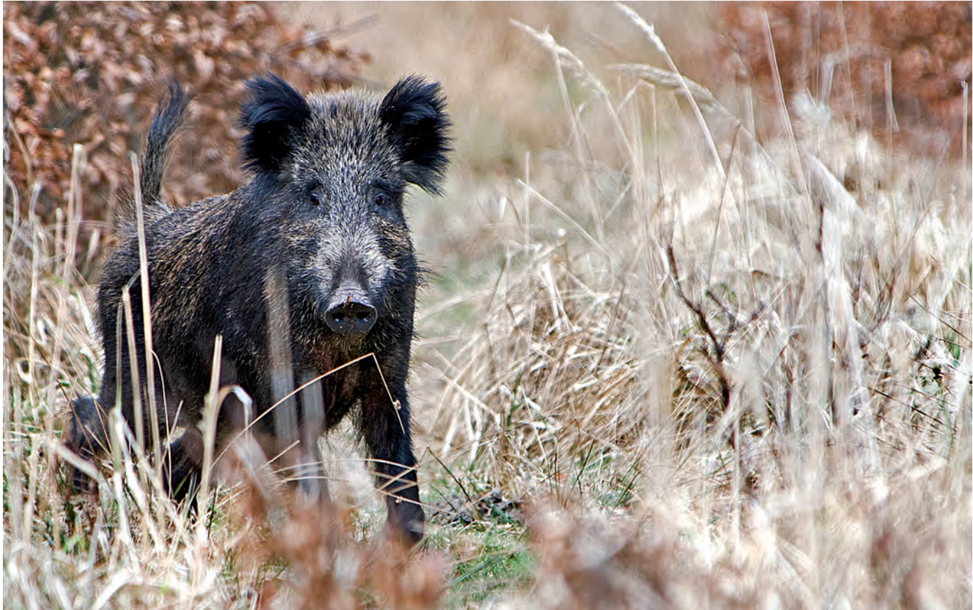
Waldemar Feculak: „Okno w okno”