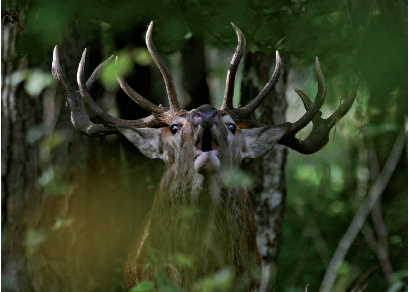
Krzysztof Sokal: „Vis à vis”