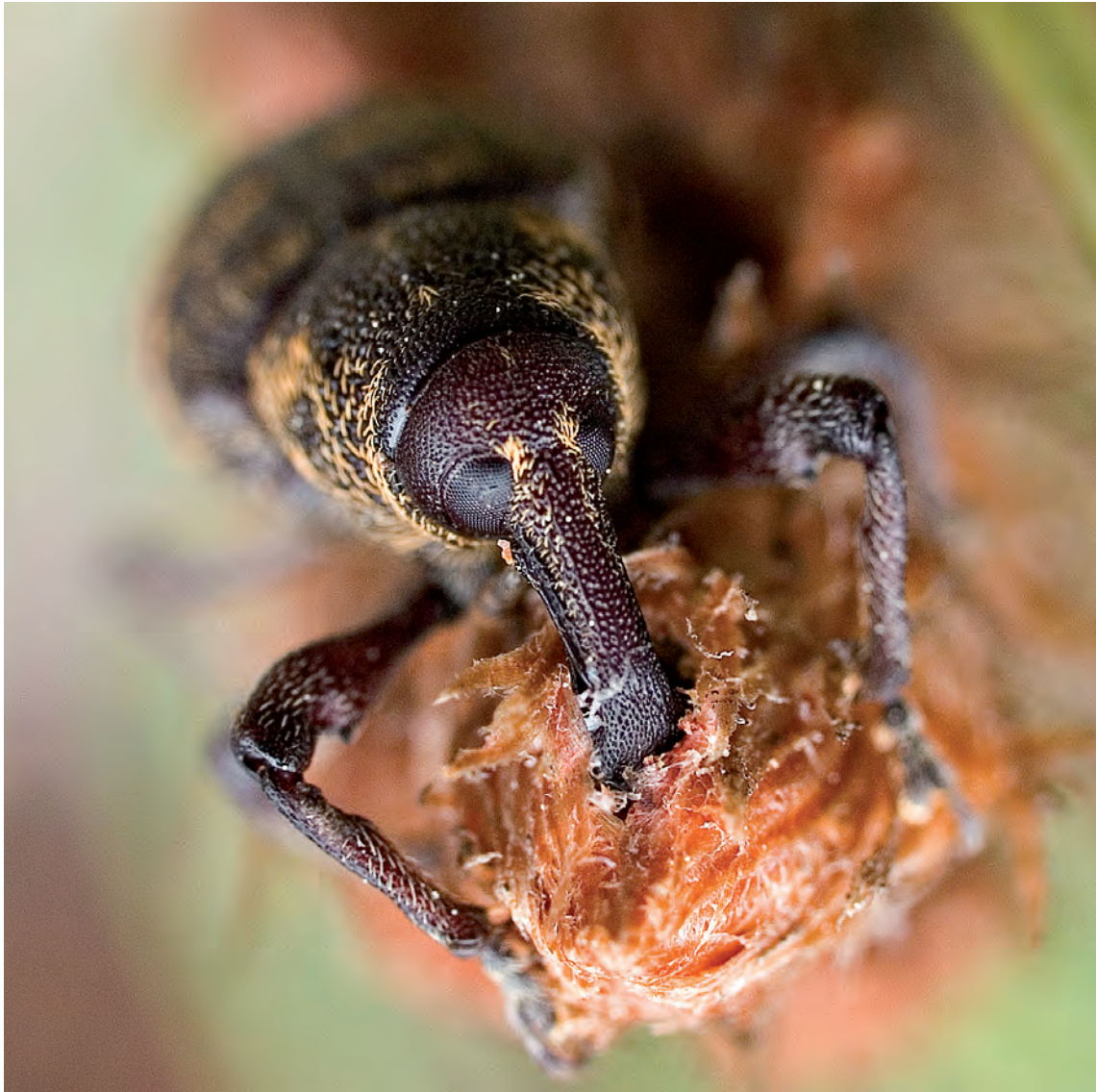
Tomasz Banaszek: „Poszukiwany żywy lub martwy”