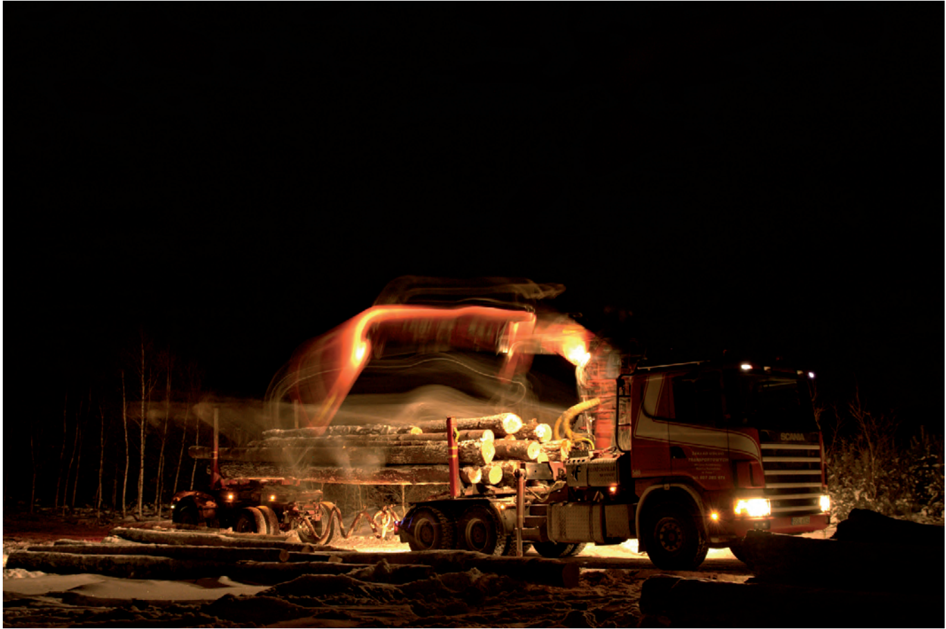
Tadeusz Przybył: „W świetle reflektorów”