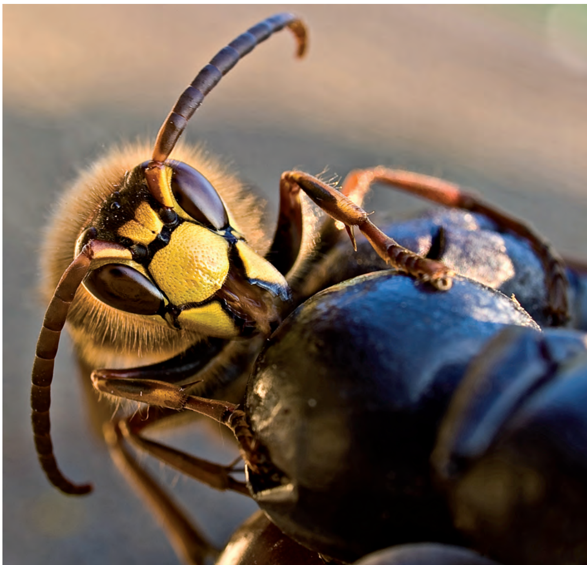
Jarostaw Krupa: „Szerszeń”