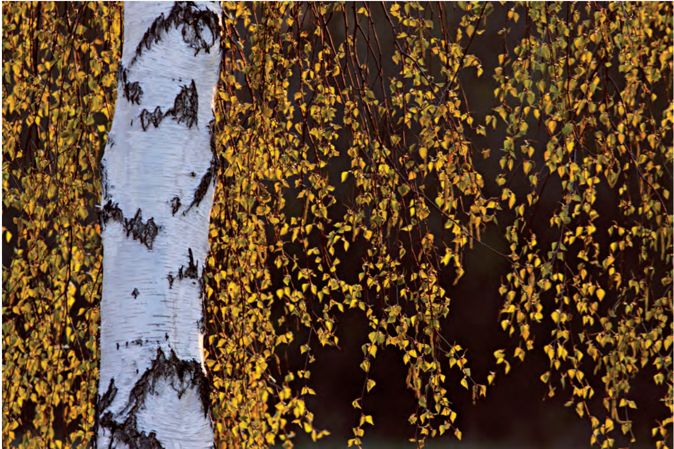
Ryszard Czaplewski: „Brzoza”