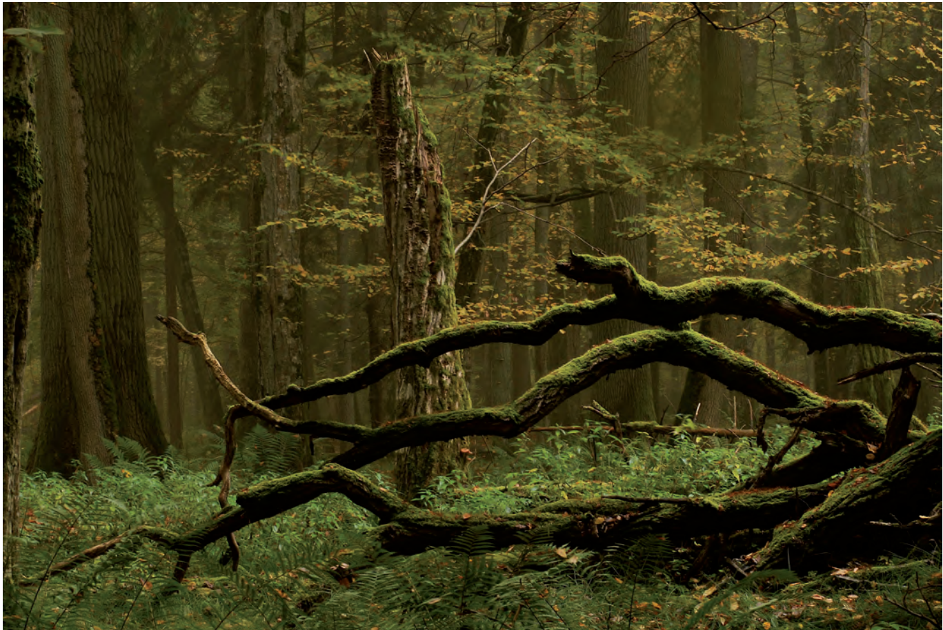
Łukasz Adamski: „Szpon”