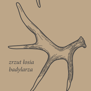
zrzut losia badylarza